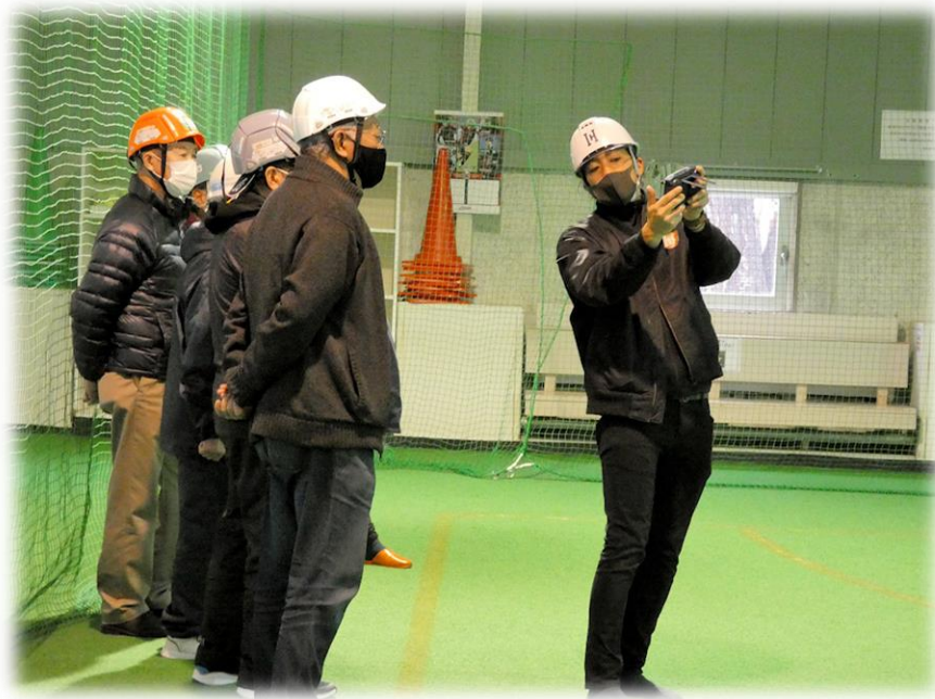
会場の福住屋内運動広場にて（令和5年3月実施 基礎トレーニングの様子）