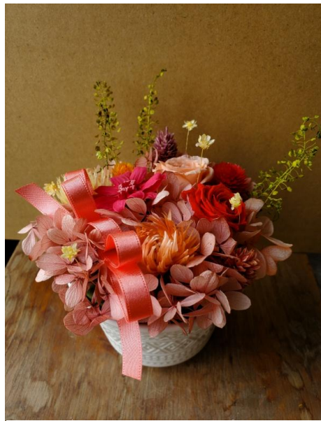
令和8年1月29日実施演習サンプル