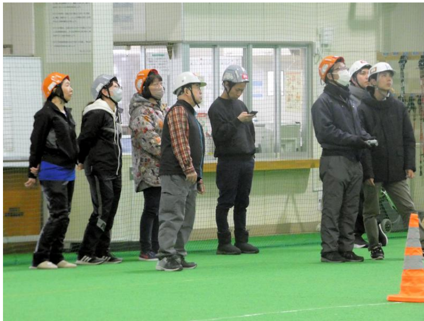
会場の福住屋内運動広場にて（令和7年3月実施 基礎トレーニングの様子）